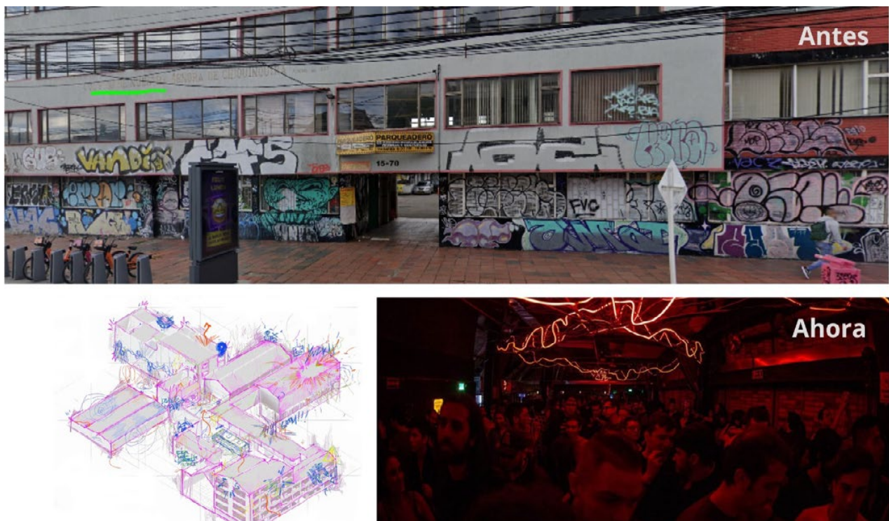
Figura 2. Transformación del edificio del Proyecto Kínder: de infraestructura educativa a espacio cultural en Bogotá

En particular, se reutilizaron componentes estructurales metálicos, mobiliario, elementos de iluminación y materiales de acabado, los cuales fueron integrados en el nuevo diseño arquitectónico mediante procesos de adaptación funcional y estética. Esta estrategia no solo reduce el impacto ambiental asociado a la construcción, sino que también conserva