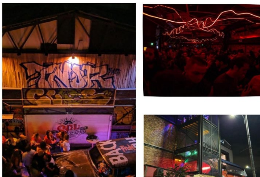
Figura 1. Interior y exterior del Club Kaputt, Bogotá.