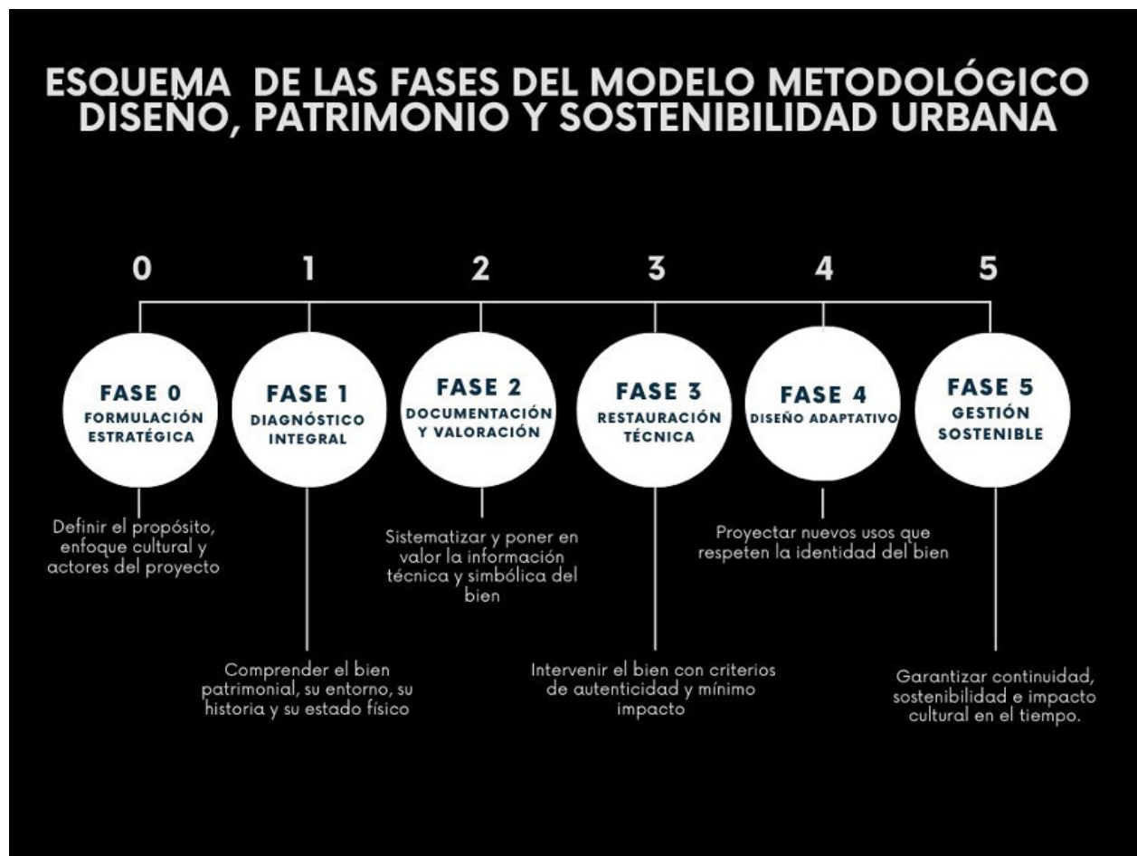
Figura 4. Esquema del modelo metodológico de intervención en patrimonio urbano.